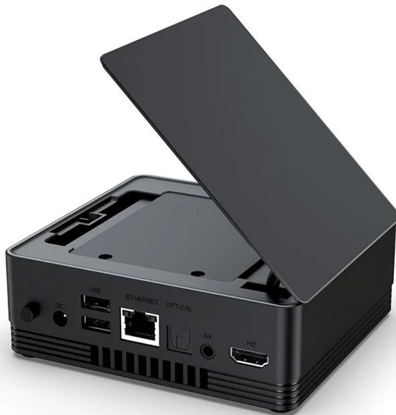
Bild HD JPEG, BMP, GIF, PNG, TIF Sprache Englisch Französisch Deutsch Spanisch Italienisch usw. multilaterale Sprachen Durchsuchen Sie alle Video-Websites, unterstützen Sie Netflix, Hulu, Flixster, Youtube usw. Option Apps können kostenlos vom Android Market, Amazon App Store usw. heruntergeladen werden. Lokale Medienwiedergabe, unterstützt Festplatte, U-Disk, TF-Karte.