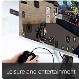
Leisure and entertainment