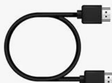
HD data cable