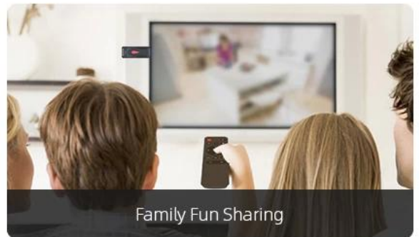
Family Fun Sharing