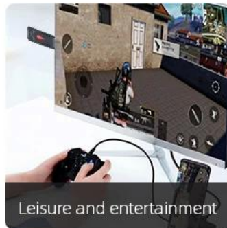
Leisure and entertainment