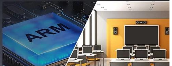
ARM architecture computer/Mini PC