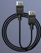
HD data cable*1