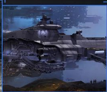
Super clear movie