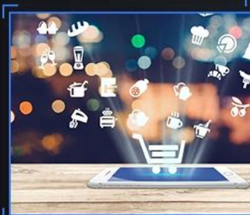
Extreme speed internet